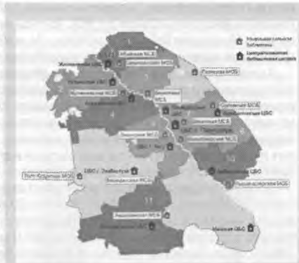
Карта модельных сельских библиотек Павлодарской области.

Программа завершилась. Есть результаты: книгообеспеченность выросла с 4 до 6 книг на одного жителя; налицо положительная динамика обновляе-