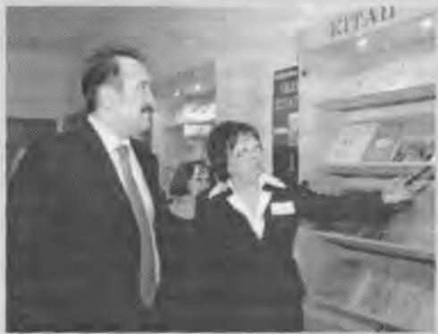
Визит премьер-министра Казахстана К. Масимова в областную библиотеку.

форматизация библиотек области стала платформой для дальнейшего внедрения новых технологий. В 2007 году в ОУНБ (одной из первых в области) был установлен пункт общественного доступа к сайту электронного правительства, затем пункты общественного доступа открыты еще в 11 районных библиотеках. Посетители библиотек получают разноплановую информацию по социальным проблемам, оформ-