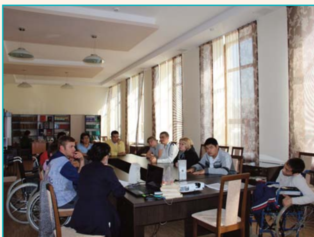
Мероприятие для инвалидов-колясочников