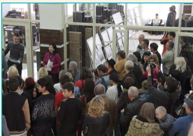
Художественная галерея «AINA»