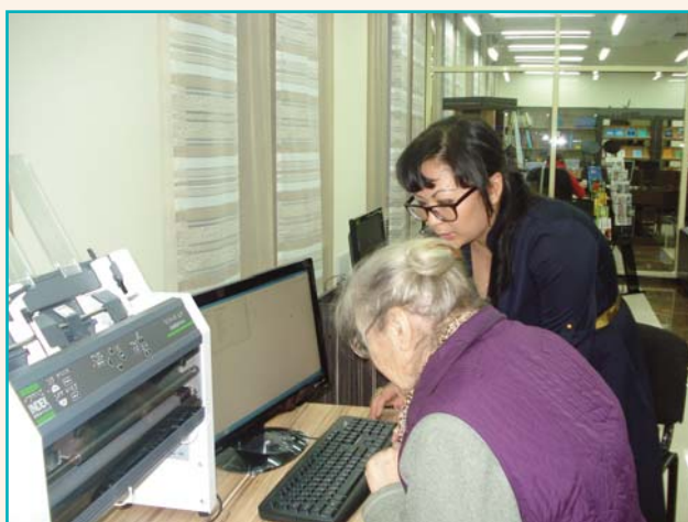
Курсы для инвалидов

клубов: «Краеведение», «Наш очаг», «Фиалочка», «Мастерица», «My English», «ЗОЖ», экологического лектория «Зеленая планета», литературно-музыкальной гостиной «Визит», видеолектория «Мировая художественная культура», театральной студии «Во-яж» и др.