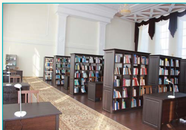
Универсальный читальный зал