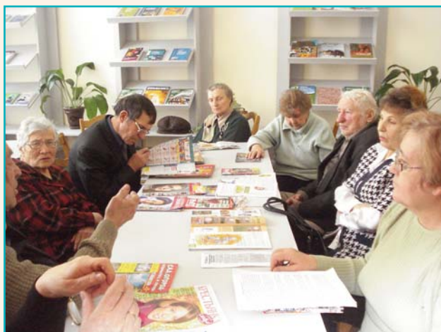
Клуб «Наш очаг»