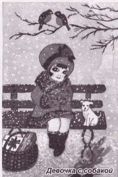
Девочка с собакой