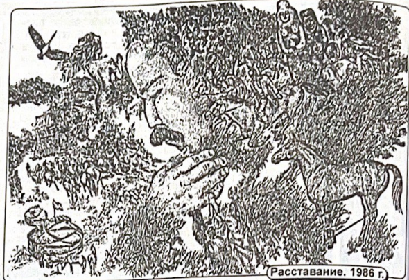
Расставание. 1986 г.