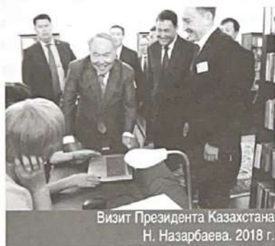
Визит Президента Казахстана Н. Назарбаева. 2018 г.

Одним из значимых событий года является проведение Дня библиотек Пав-